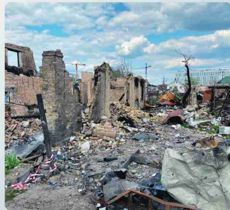
▲ 露軍による攻撃で破壊されたとみられる住宅=キーウ近郊のブチャで2022年5月