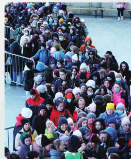
▲ 隣国ポーランドへ避難してきたウクライナの人々=2022年3月