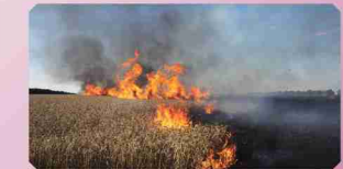
▲ 侵攻で燃えるウクライナの小麦畑=ハリコフ州で2022年7月

農業が盛んで、世界有数の穀物(小麦など)輸出国であるウクライナからの穀物輸出が滞り、アフリカなどの途上国で飢餓が心配される事態となりました。