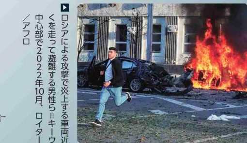
▲ ロシアによる攻撃で炎上する車両近くを走って避難する男性ら=キーウ中心部で2022年10月